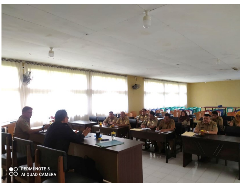
Rapat Persiapan Kegiatan Penegakan Hukum Ketenagkerjaan tanggal 15 Januari 2024