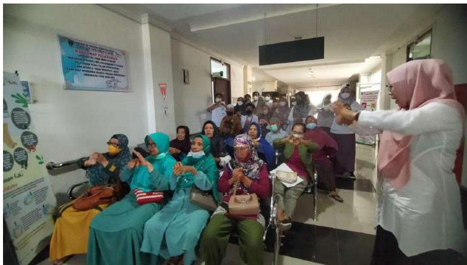
Praktek cuci tangan