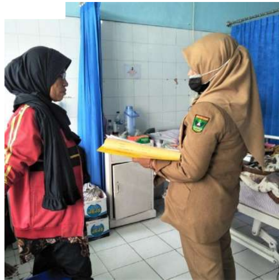
Tanya jawab dengan keluarga pasien