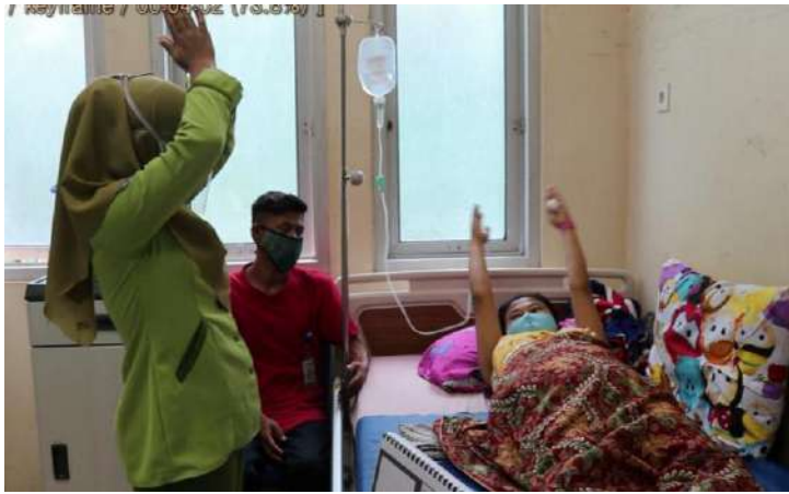
Praktek senam nifas