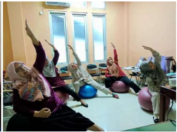
Kelas Ibu Hamil