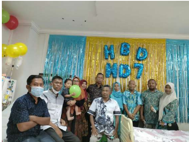
Peringatan HUT HD yang ke 7 mengundang seluruh anggota komunitas