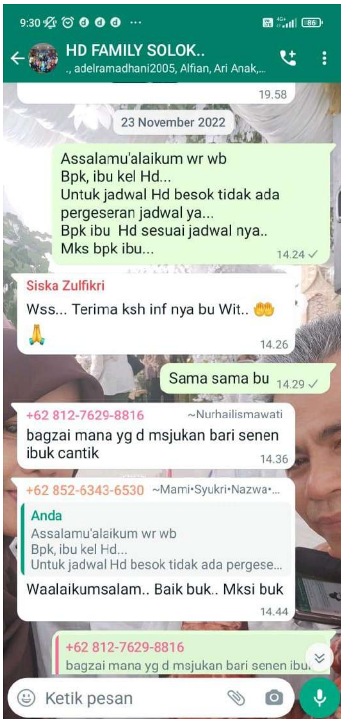
Petugas mengingatkan jadwal kontrol pasien yang akan melakukan cuci darah