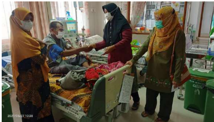
Sesama anggota komunitas saling memberikan semangat