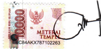
ABASRIL, ST Konsultan Individu Teknik Sipil Transportasi

Untuk dan atas nama Penyedia Jasa Konsultan Konstruksi Perorangan