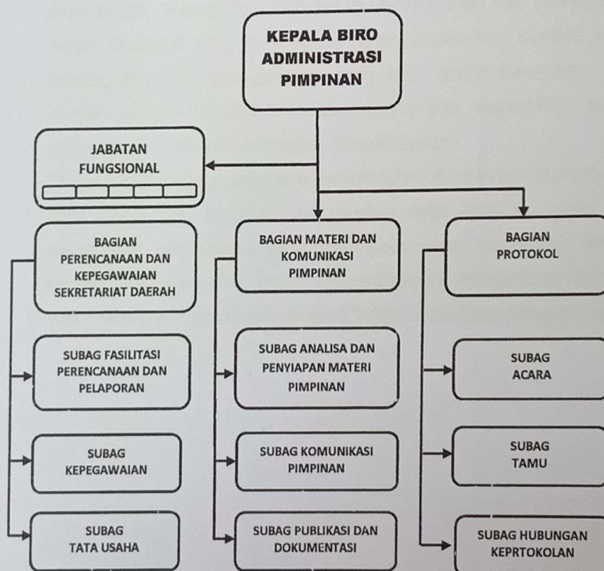
Gambar II.1 Struktur Organisasi Biro Administrasi Pimpinan Sekretariat Daerah Provinsi Sumatera Barat

Struktur internal Biro Administrasi Pimpinan Sekretariat Daerah Provinsi Sumatera Barat secara hirarkis sebagaimana diatur dalam Peraturan Gubernur Sumatera Barat Nomor 74 Tahun 2020 , dapat dilihat pada bagan gambar II.1. berikut :